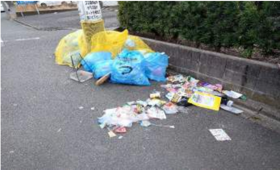
共同ゴミ集積場所 A