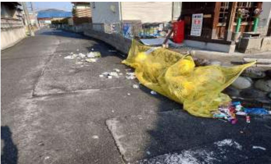
共同ゴミ集積場所 B